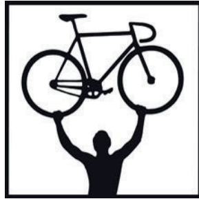
COBOC – Muscle Synchroni- zed eCycles COBOC eCycles