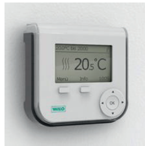
Wilo-Geniix – Das Dezentrale Pumpensystem