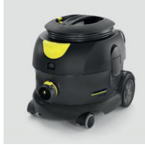
Trockensauger T 12/1 eco!efficiency