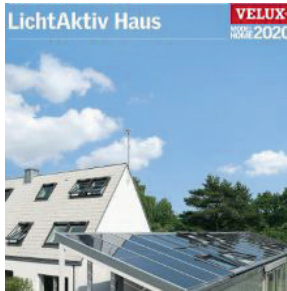
Velux LichtAktiv Haus VELUX Deutschland GmbH