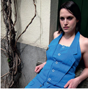
Bis es mir vom Leibe fällt