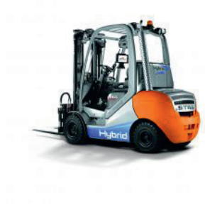
RX 70 Hybrid mit Blue-Q